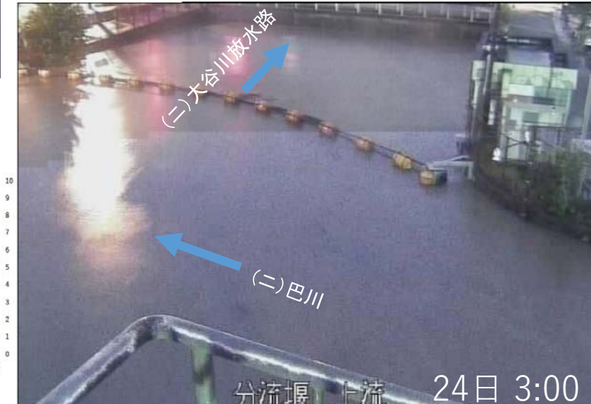
降雨量・河川水位(上土地点)の状況