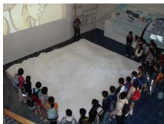
静岡市治水交流資料館