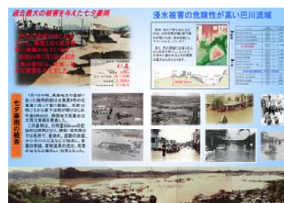
七夕豪雨リーフレット