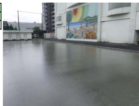
雨水貯留浸透施設の状況 (豊田中学校 令和3年8月撮影)