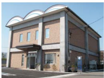
静岡市治水交流資料館

また、当館の企画イベントとして「巴川バスツアー」を毎年7～8月に開催し、当館、麻機遊水地、大谷川放水路などを見学し、目で見て、説明を聞くことにより、治水事業への関心と防災意識の啓発を図っています。