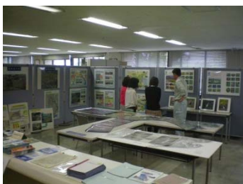
静岡県静岡総合庁舎（2階）