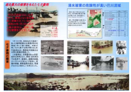
七夕豪雨リーフレット