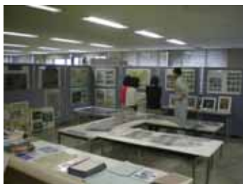
静岡県静岡総合庁舎（2階）

また総合治水推進週間、河川愛護月間では、静岡市役所静岡庁舎においても事業を紹介するパネル展を行っています。