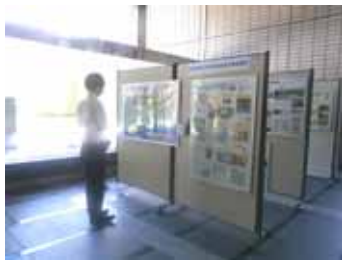
静岡市役所静岡庁舎（1階ロビー）