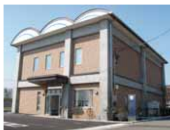
静岡市治水交流資料館

また、当館の企画イベントとして「治水を学ぼう！巴川バスツアー」を毎年7～8月に2日間開催し、70名程度の参加者が、当館、麻機遊水地、大谷川放水路などを見学し、目で見て、説明を聞くことにより、治水事業への関心と防災意識の啓発を図っています。