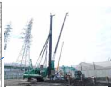
ポンプ施設 高橋雨水ポンプ場 平成26年度 ポンプ場土木工事実施中