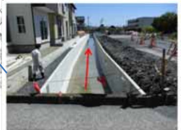
函渠工 巴川左岸雨水4-5号幹線 平成26年度 函渠工事実施中 (L=95m)