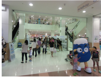
アピタ エントランスホールにて