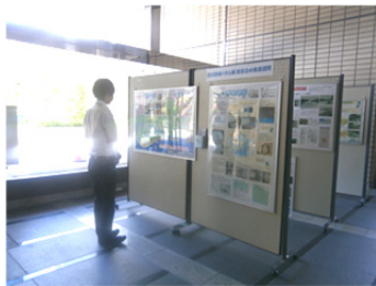
静岡市役所静岡庁舎（1階ロビー）