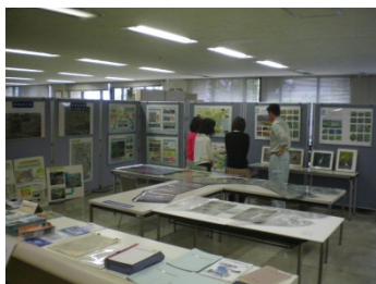
静岡県静岡総合庁舎（2階）

また総合治水推進週間、河川愛護月間では、静岡市役所静岡庁舎においても事業を紹介するパネル展を行っています。