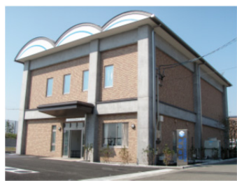
静岡市治水交流資料館

また、当館の企画イベントとして「巴川バスツアー」を毎年7～8月に開催し、当館、麻機遊水地、大谷川放水路などを見学し、目で見て、説明を聞くことにより、治水事業への関心と防災意識の啓発を図っています。