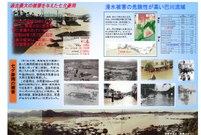
七夕豪雨リーフレット