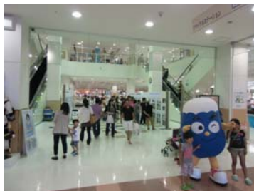
アピタ エントランスホールにて