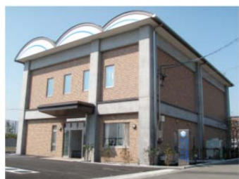
静岡市治水交流資料館

また、当館の企画イベントとして「治水を学ぼう！巴川バスツアー」を毎年7～8月に2日間開催し、70名程度の参加者が、当館、麻機遊水地、大谷川放水路などを見学し、目で見て、説明を聞くことにより、治水事業への関心と防災意識の啓発を図っています。