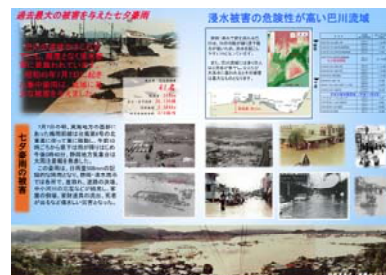
七夕豪雨リーフレット