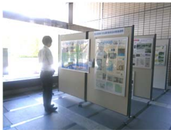
静岡市役所静岡庁舎（1階ロビー）