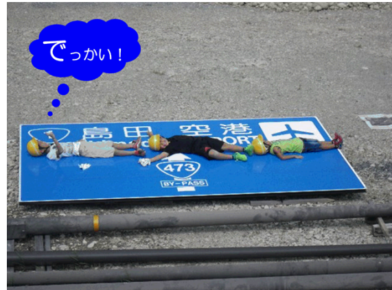
道路案内標識の大きさを体感