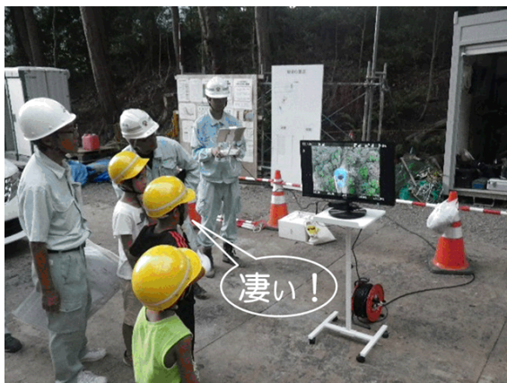
ドローンによる空撮の体験