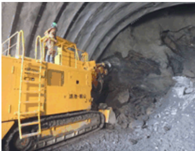
自由断面掘削機による掘削の様子

※貫通式典以降も、引き続き地山の補強や舗装、照明等の工事を施工し、 平成30年3月の供用を目指します。