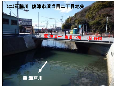
床上浸水被害軽減