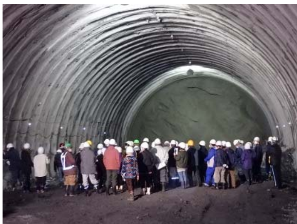
トンネルの大きさを実感