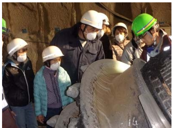
この大きな爪で山を掘ります