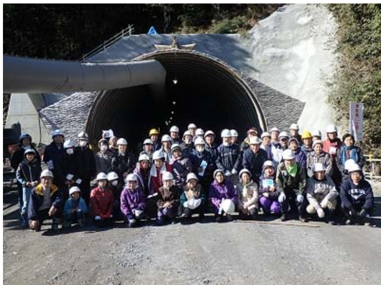
参加者全員で記念撮影