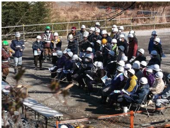
施工業者からの工事説明

参加者からは、「歩いてみるとトンネルが思いのほか大きくて驚いた。」、「長年待ち望んでいた道路を早く通りたい。」との感想をいただきました。