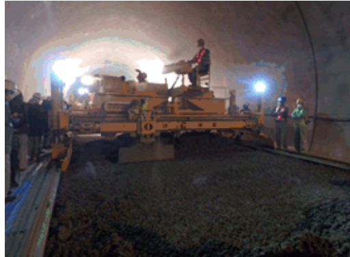
敷き均し（コンクリートスプレッダ）