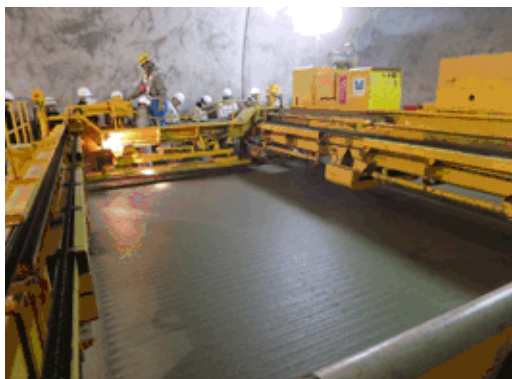
仕上げ（コンクリートレベラ）