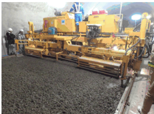
締固め（コンクリートフィニッシャ）