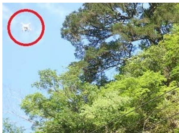
そこでドローンを使ってみると…