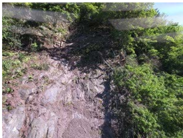
ドローンによる斜面拡大写真