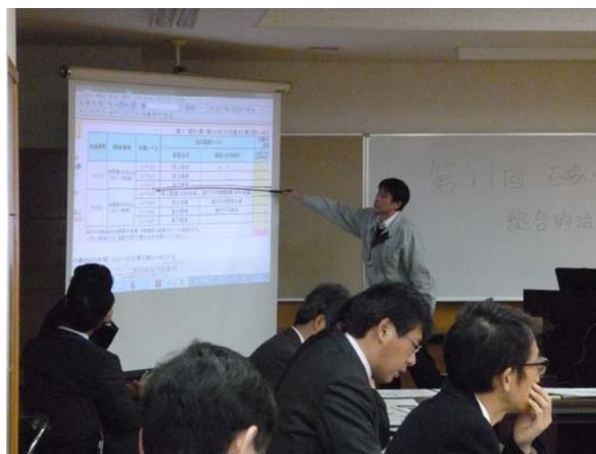
事務局からの説明の様子