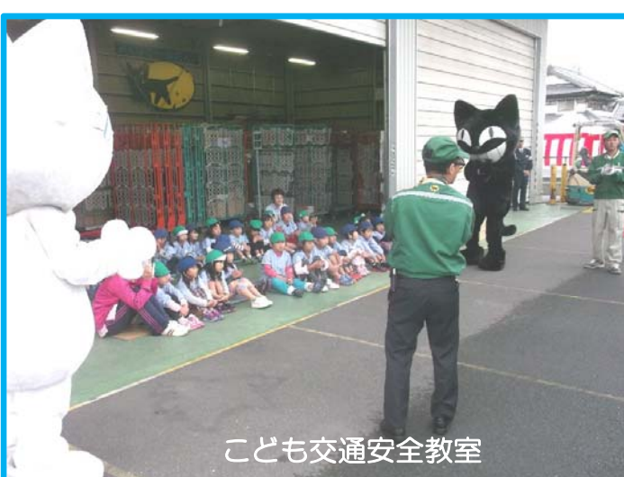
こども交通安全教室

[お問合せ] 静岡県島田土木事務所工事第3課 [電話番号] 0547-37-1087