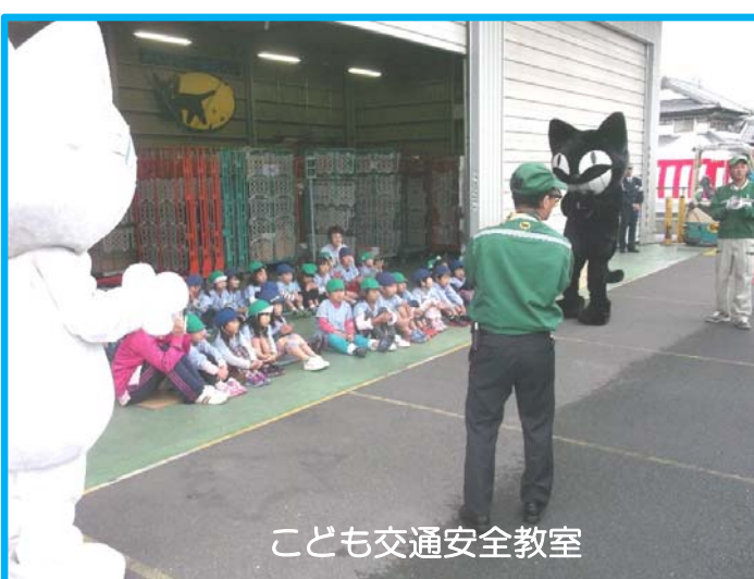
こども交通安全教室

[お問合せ] 静岡県島田土木事務所工事第3課 [電話番号] 0547-37-1087