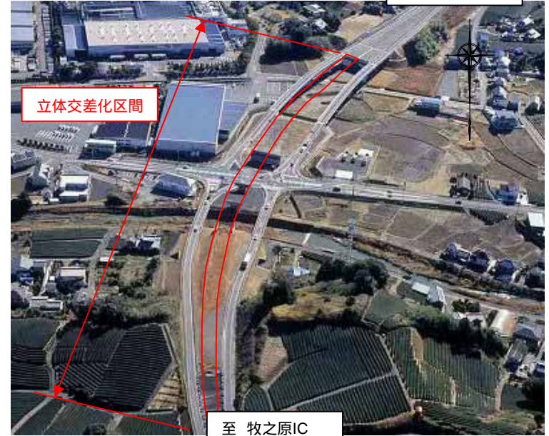
今回供用する菅山ICの写真