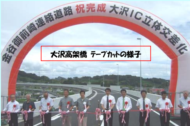
大沢高架橋 テープカットの様子