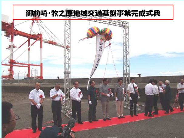
御前崎・牧之原地域交通基盤事業完成式典