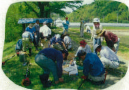
竹刈用チップソー装着