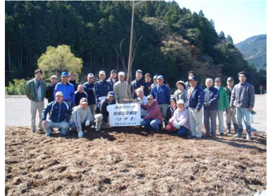
「みなりパーク」多目的広場 完成記念植樹会 記念写真

Cさん) 少子高齢化が進む中で、若い世代に取組を引継ぎ、活動を続けていけるようにすることが大きな課題だと思います。