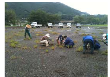
地域の方々による草刈のようす