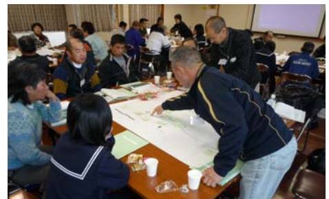
ワークショップのようす

なお、計画策定後は、みんなで計画した河川公園(多目的広場やクロスカントリーコース)を、“みなりパーク”と命名し、地元組織“みなりパーク委員会”を発足させて、現在は、今後の維持管理などを検討しています。