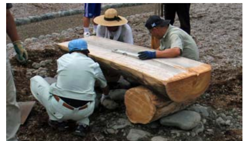
みんなでDIY! 手作りで樹名板やテーブルベンチを製作