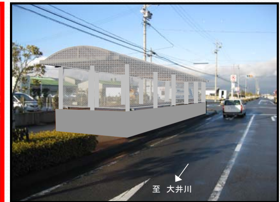
既設地下横断歩道(高新田地下道)