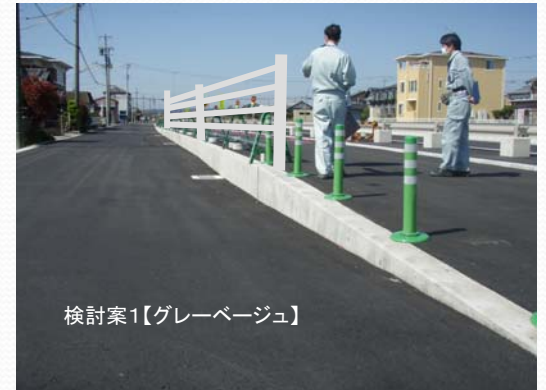
検討案1【グレーベージュ】