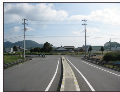
検討案1【ダークブラウン】