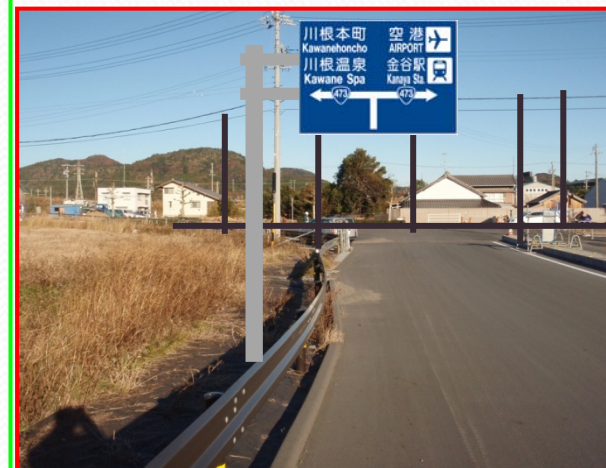
検討案2【亜鉛メッキ】