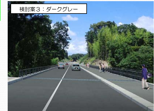
検討案3：ダークグレー