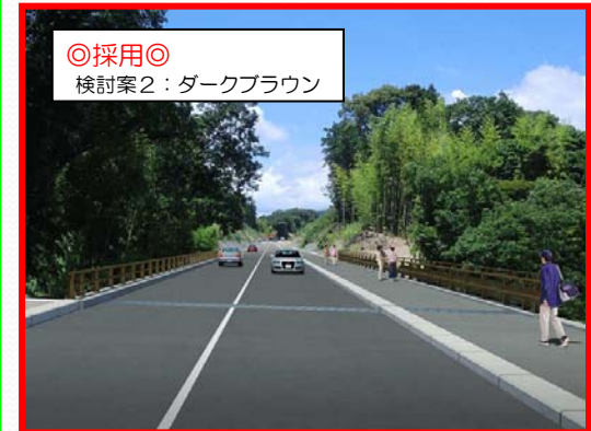
◎採用◎ 検討案2：ダークブラウン