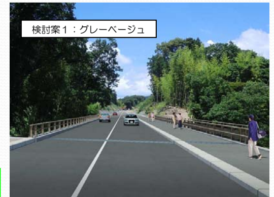
検討案1：グレーベージュ