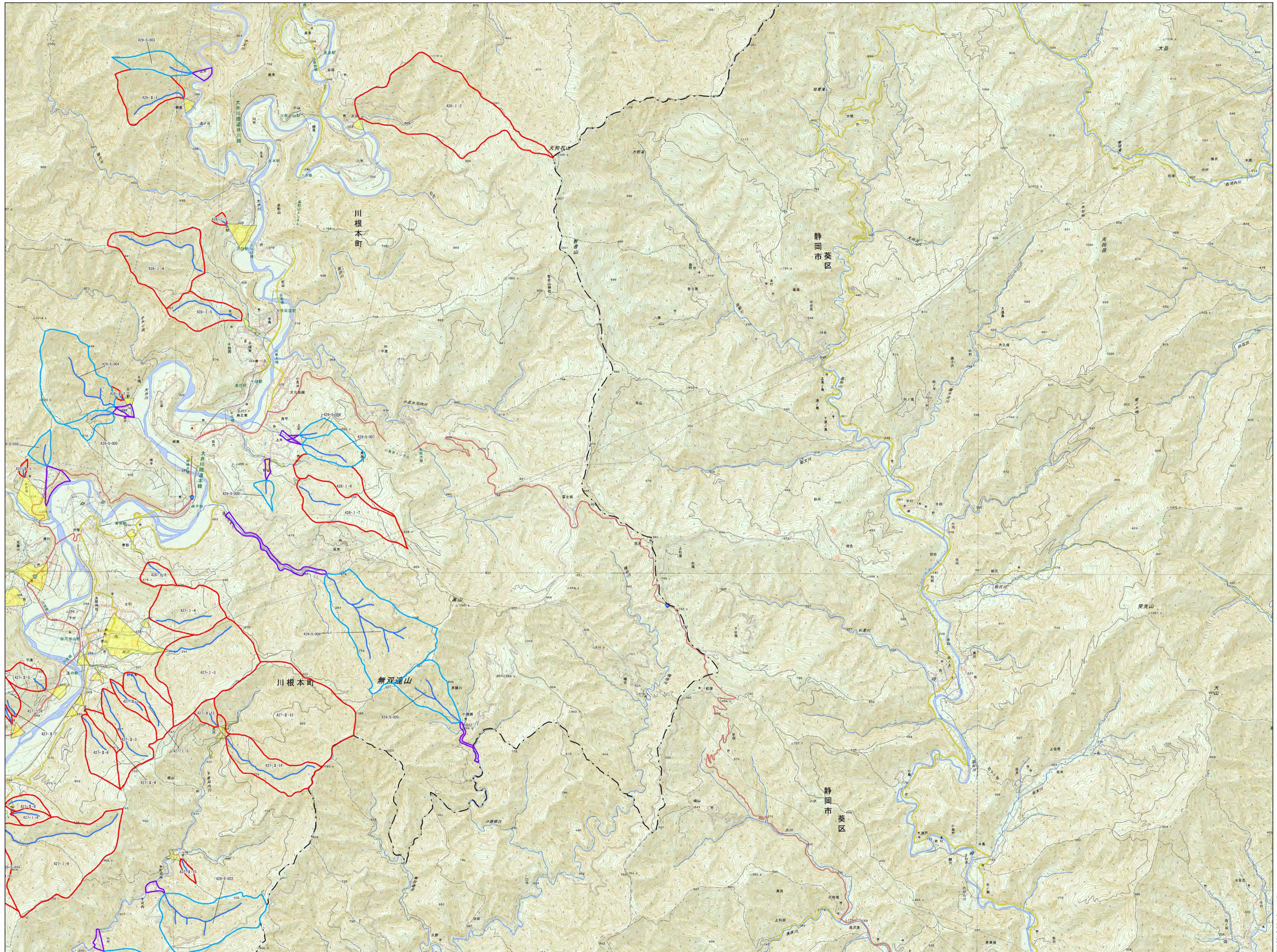
土石流抽出結果平面図 4/5 (川根本町)