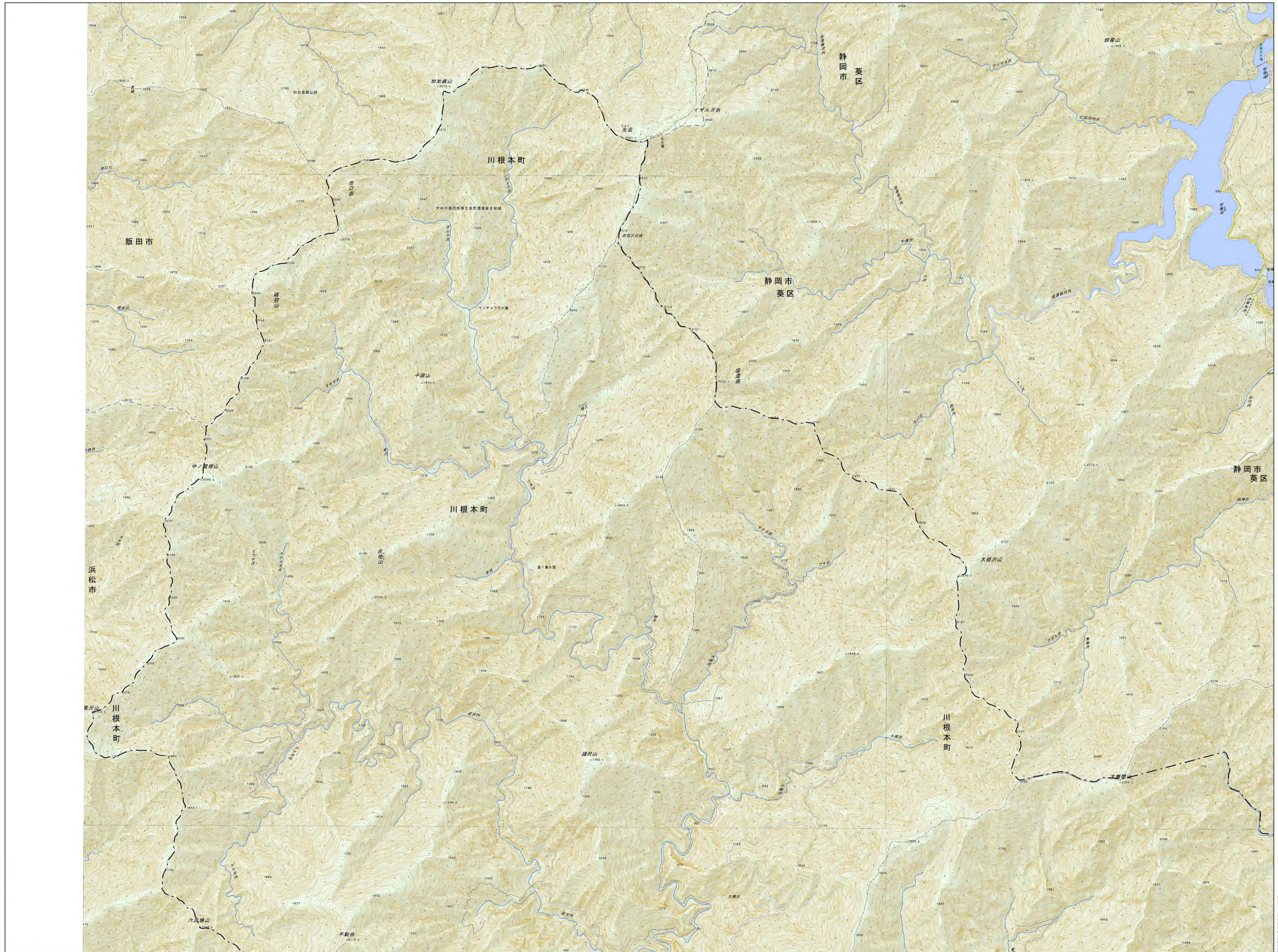
土石流抽出結果平面図 1/5 (川根本町)