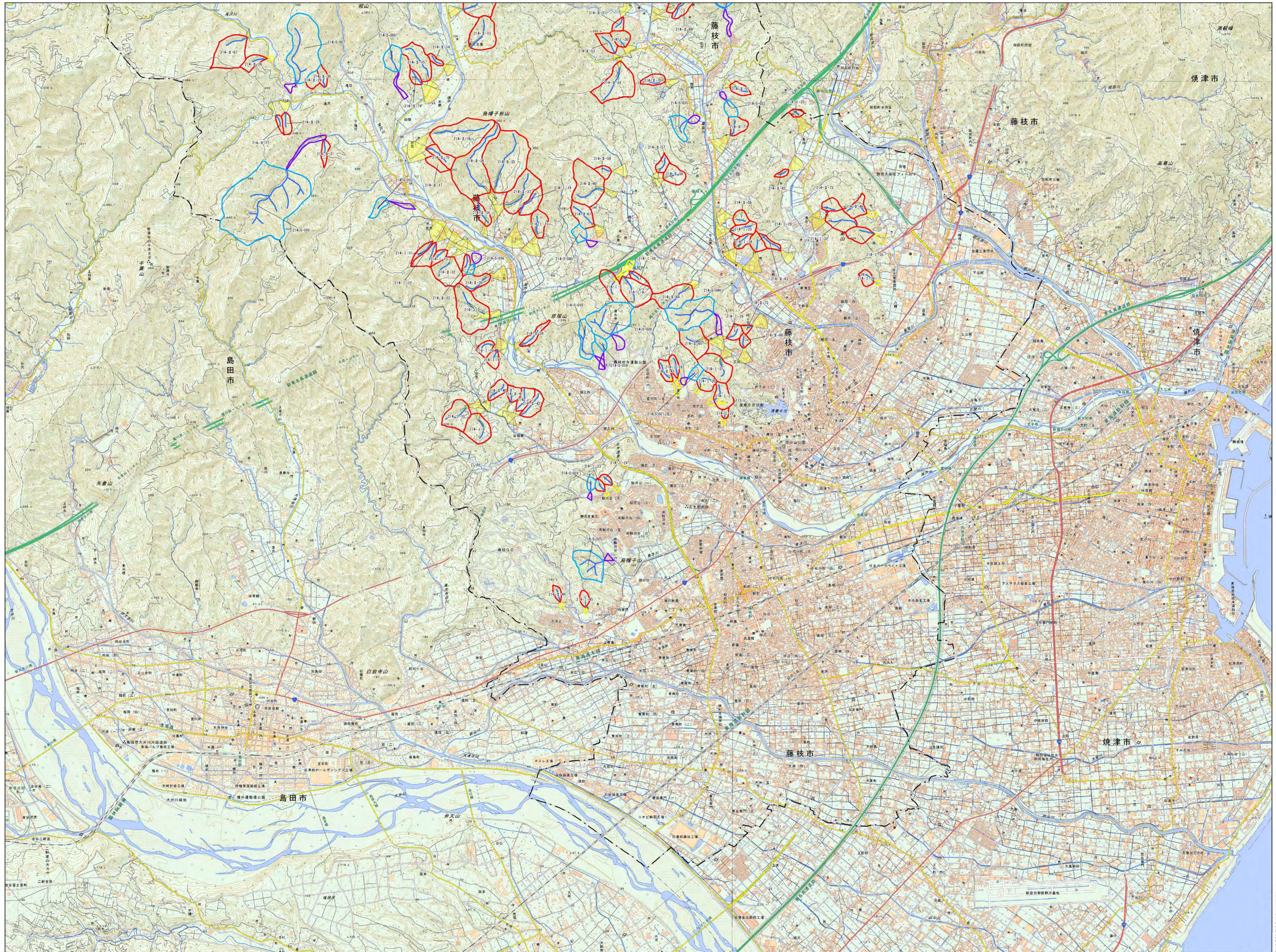
土石流抽出結果平面図 2/3 (藤枝市)