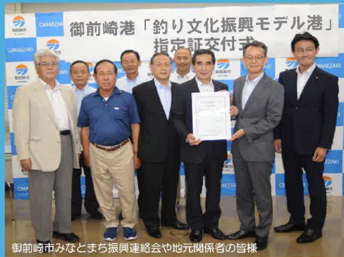
御前崎市みなとまち振興連絡会や地元関係者の皆様