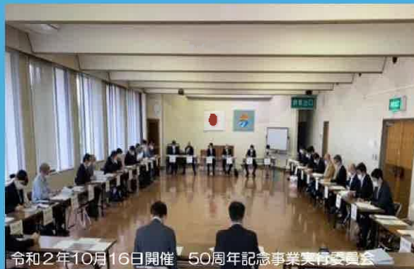
令和2年10月16日開催 50周年記念事業実行委員会