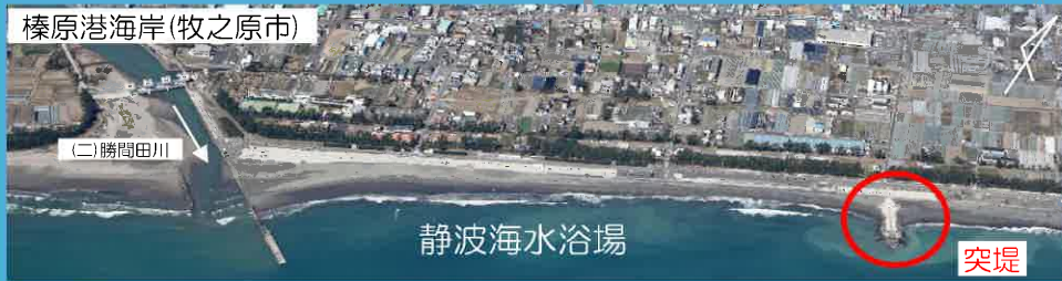
榛原港海岸(牧之原市)