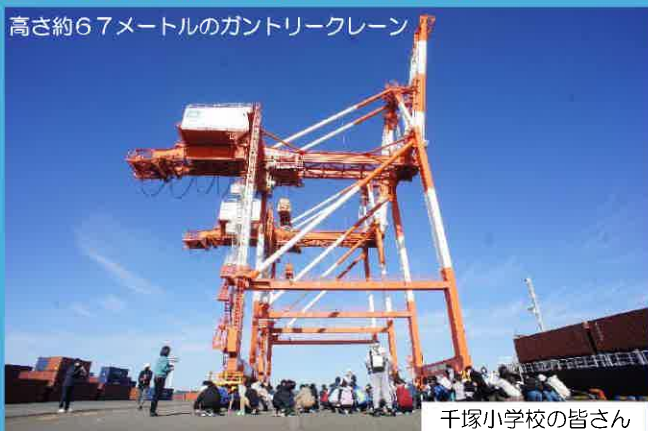
高さ約67メートルのガントリークレーン