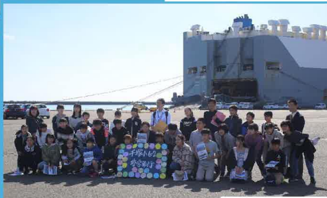
完成自動車を積み込む自動車運搬船

また、11月12日(木)には、同じく甲府市の大里小学校の児童たちも修学旅行で訪れてくれました。