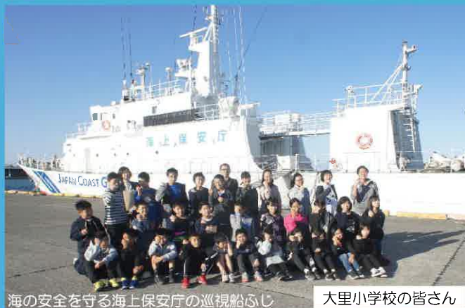
海の安全を守る海上保安庁の巡視船ふじ