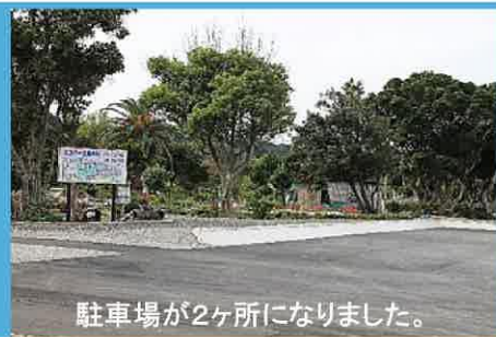
駐車場が2ヶ所になりました。

10月の園内は秋を彩る花が咲き、多種類のどんぐりも実りの季節を迎えています。駐車場と園路が新しくなっていますので、密を避けながらエコパークの秋を見つけてみてはいかがでしょうか。