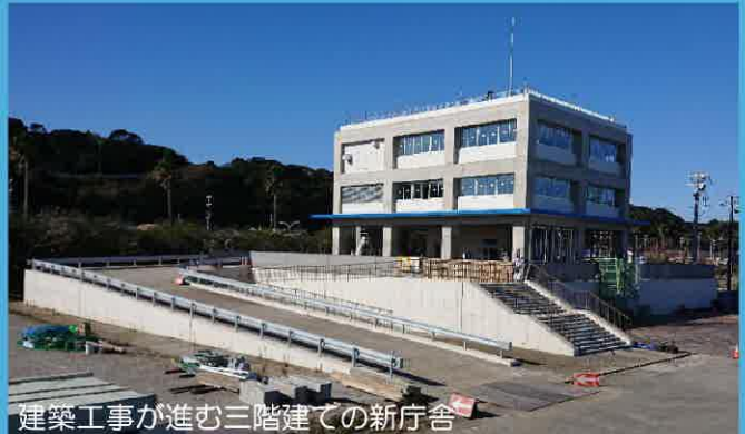
建築工事が進む三階建ての新庁舎