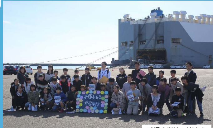
完成自動車を積み込む自動車運搬船

また、11月12日(木)には、同じく甲府市の大里小学校の児童たちも修学旅行で訪れてくれました。