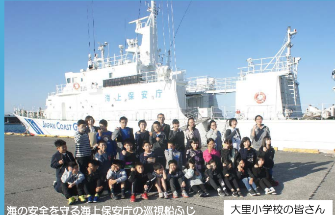
海の安全を守る海上保安庁の巡視船ふじ