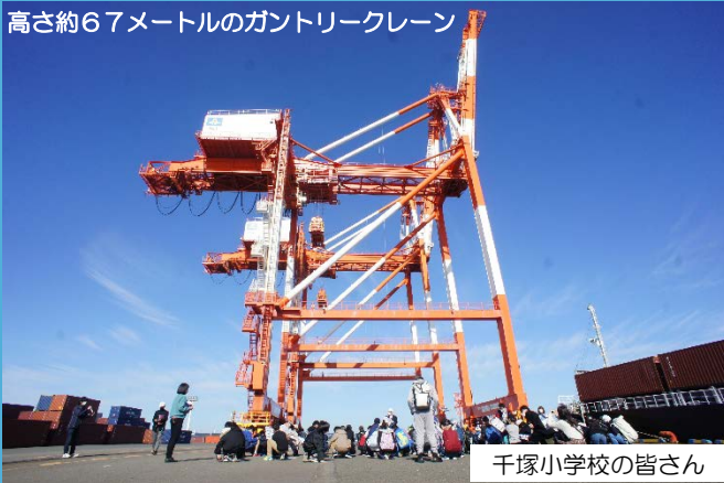
高さ約67メートルのガントリークレーン