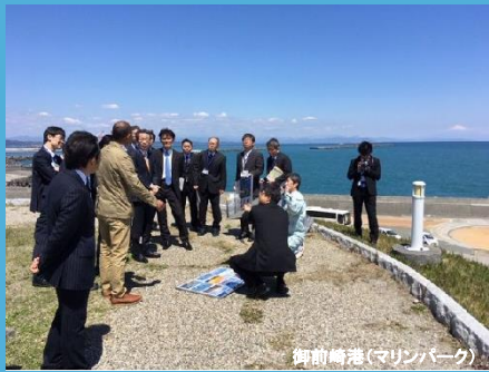
御前崎港(マリナーパーク)