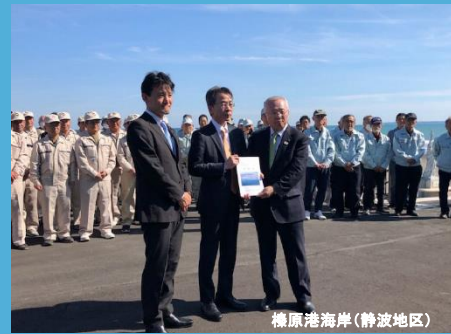
榛原港海岸(静波地区)