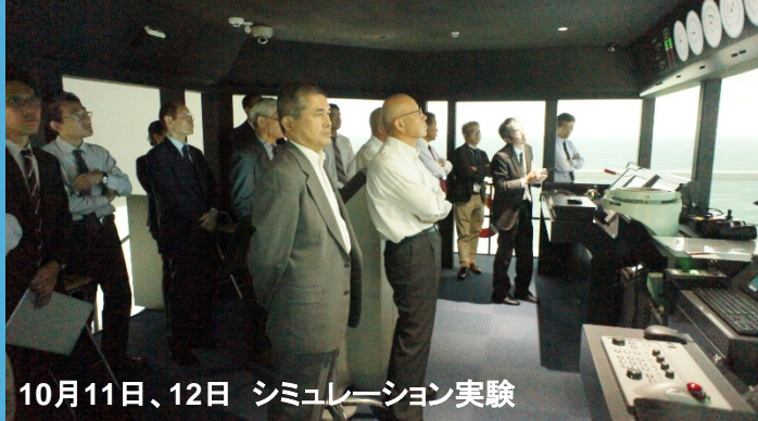
10月11日、12日 シミュレーション実験