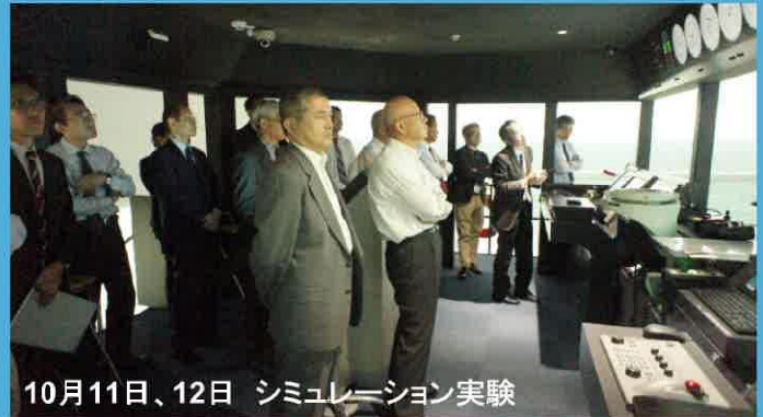
10月11日、12日 シミュレーション実験