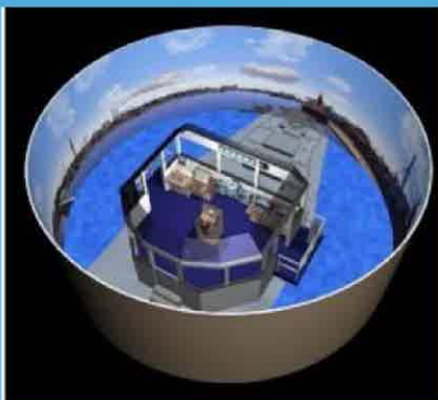
ビジュアル操船 シミュレーター