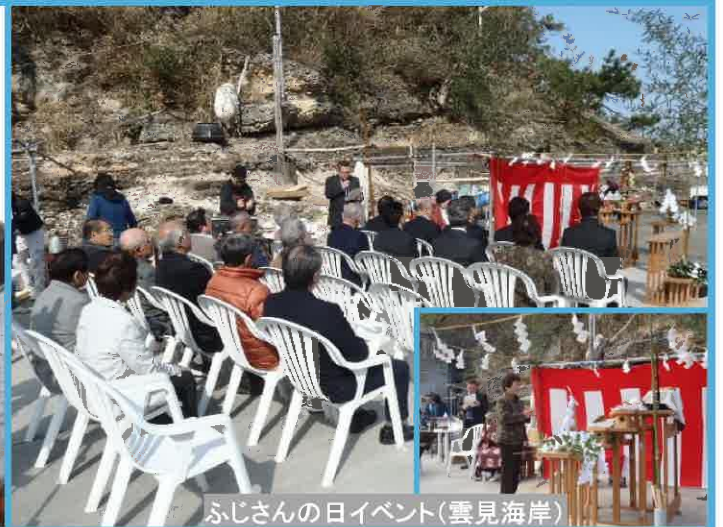
ふじさんの日イベント(雲見海岸)