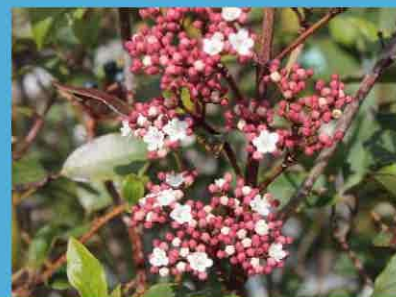
ジンチョウゲ (ジンチョウゲ科)

ヨーロッパ原産の宿根草です。ピンクの小さい花が株を覆うように咲きます。これから5月にかけて楽しめます。