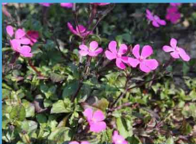
ツルコザクラ (ナデシコ科)

ヨーロッパ原産の宿根草です。ピンクの小さい花が株を覆うように咲きます。これから5月にかけて楽しめます。