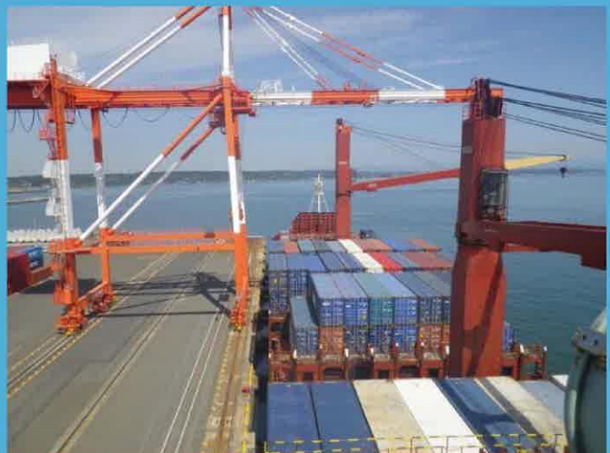
RHL AQUA船内の展望室から撮影

御前崎港ポートセールス実行委員会では、今後もポートセールス活動やインセンティブ等の取組により、御前崎港の利用促進が図られるよう努力してまいります。