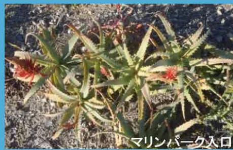
マリンパーク入口

園内では、アロエの花が見頃を迎えています。東側の道路の所、グラウンドの南側などに、寒さの中力強くオレンジの花を咲かせています。また、昨年5月に、このアロエを株分けして、マリンパークの入り口の花壇に植栽しました。こちらは数年後に、たくさんの花が咲く予定です。