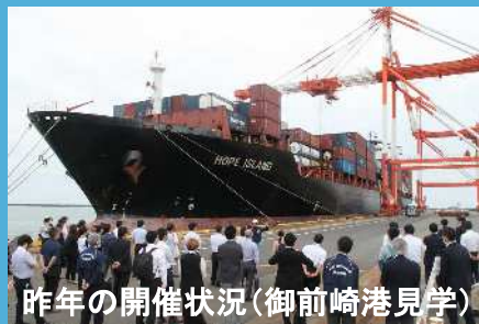
昨年の開催状況(御前崎港見学)

御前崎港を国際物流の拠点として利用していただくことにより、皆様の物流効率化のお手伝いをさせていただければ幸いと考えております。