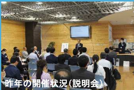
昨年の開催状況(説明会)

各回とも、午前は会場(御前崎地区センター)にて各団体からの説明会が行われ、午後はバス移動し御前崎港での現場見学会(西埠頭国際コンテナターミナル)を行う予定です。