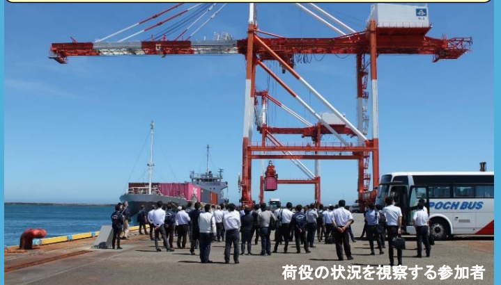
荷役の状況を視察する参加者

御前崎港コンテナターミナルにて、実際のコンテナ荷役状況を見ていただいた他、岸壁や荷捌地など充実した港湾機能をPRしました。