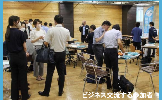
ビジネス交流する参加者