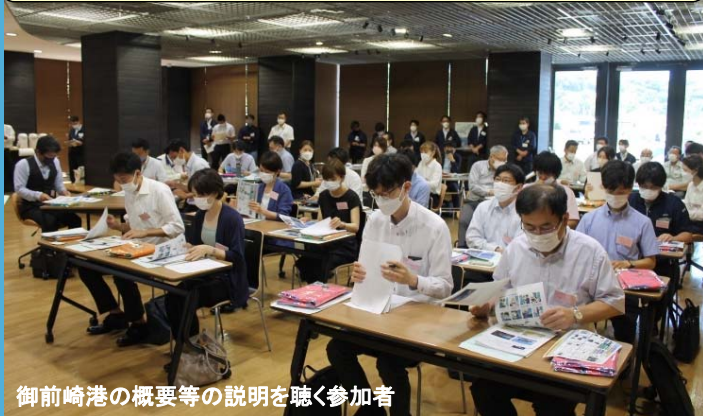
御前崎港の概要等の説明を聴く参加者

御前崎港の概要や通関状況、外航・内航コンテナ定期航路及び内航RORO定期航路をPRしました。