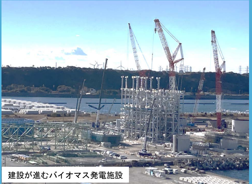
建設が進むバイオマス発電施設