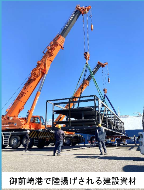
御前崎港で陸揚げされる建設資材