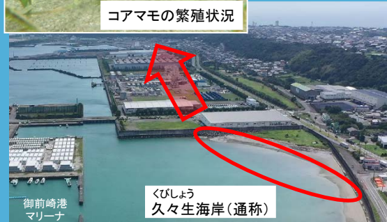
くびしゅう 久々生海岸(通称)