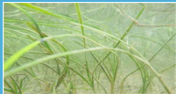
コアマモの繁殖状況