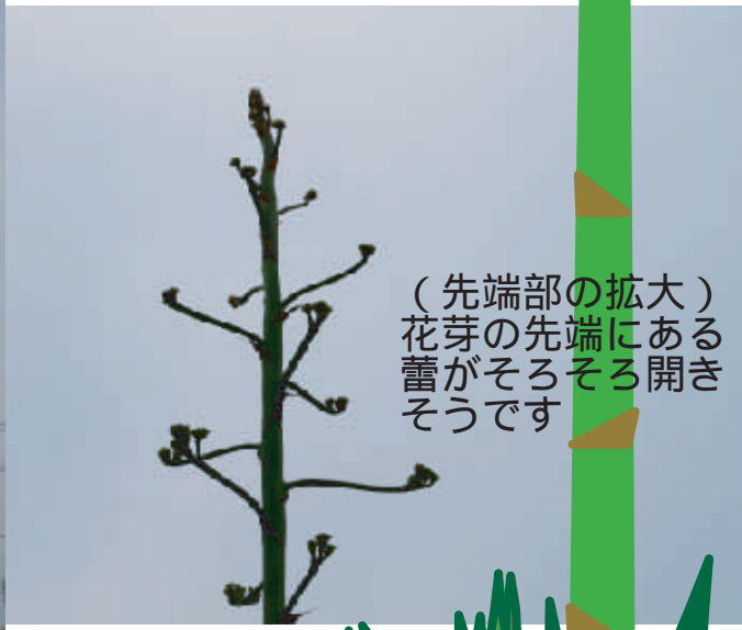
(先端部の拡大) 花芽の先端にある蕾がそろそろ開きそうです