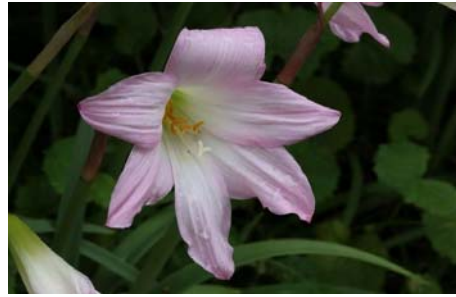
ゼフィランサス・グランディフロラ