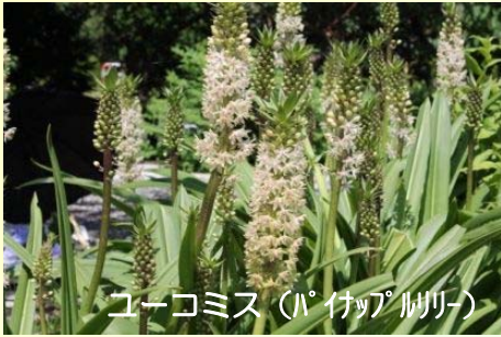
ユーコミス (パイナップルリー)

平成24年4月号から、6年余りに渡りエコパーク通信を発行してきましたが、誠に勝手ながら本号をもちまして終了とさせていただきます。今後は御前崎港管理事務所ホームページ内のエコパークのコーナーで、園内の旬な情報を写真とともに掲載していきますので、是非、ホームページを開いてみてください。