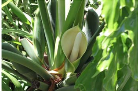
フィロデンドロン・セロウム