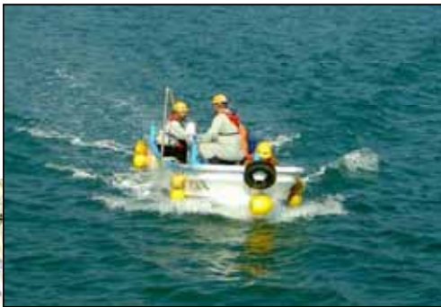
参考写真: 深淺測量状況