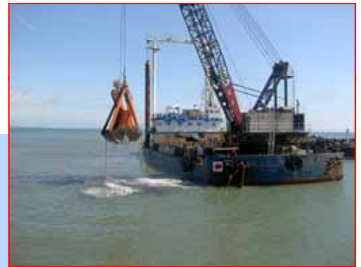
参考写真: 浚渫(積込)状況