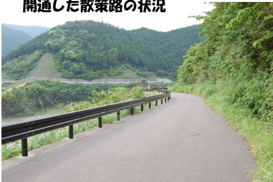
開通した散策路の状況