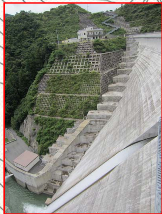
外階段は何段あるかな？