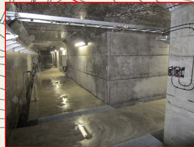
ダムの中ってこんなに〇〇...