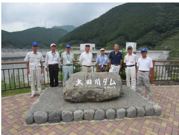
石碑の前で記念撮影