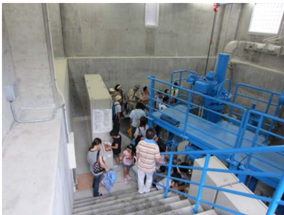
放流設備の説明を聞く参加者