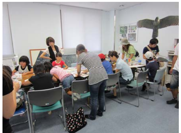
「ダムゾー」ペーパークラフト作成中