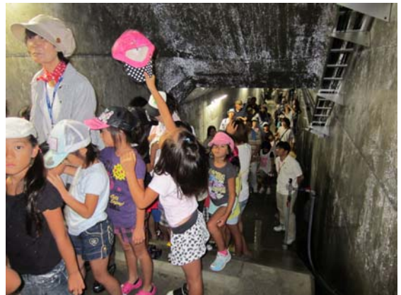
たくさんの人で大混雑