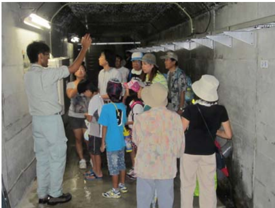
ダム内部（監査廊）で説明を聞く参加者

参加者からは、「普段は入れないダムの中に入ることができて良かった」、「ダムは川のことを考えていろんな仕事をしていることが分かった」、「スタンプラリーや、模型実験が楽しかった」「階段の上り下りが疲れたけど楽しかった。また来たい」などの声がありました。