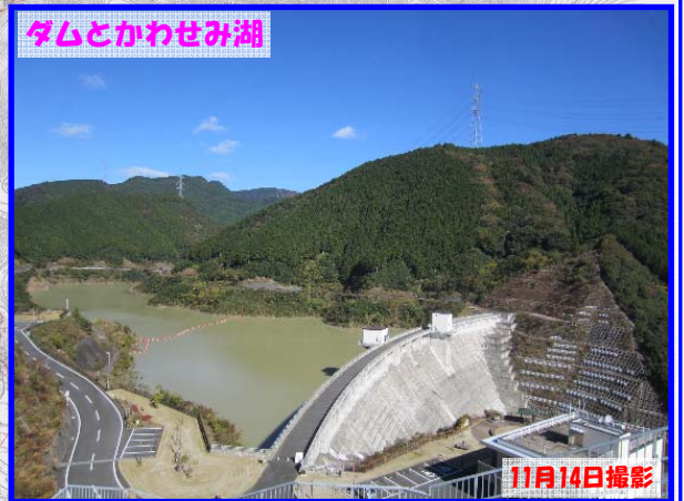
ダムとかわせみ湖