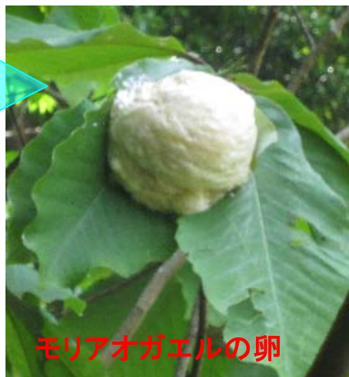
モリアオガエルの卵

モリアオガエルは「まもりたい静岡県の野生生物-県版レッドデータブック-」では、準絶滅危惧種に該当します。