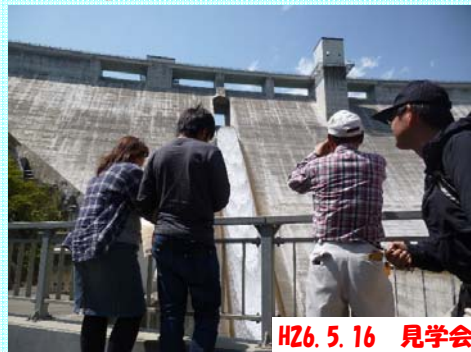
H26. 5. 16 見学会