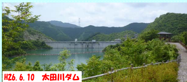
H26. 6. 10 木田川ダム