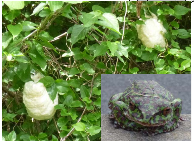
この時期、ダム周辺の木々に卵が産みつけられています。

ニホンカモシカは、シカの名前がついていますがウシ科ヤギ亜科の動物で、北海道と中国地方を除いた本州、四国、九州に生息する日本固有種です。