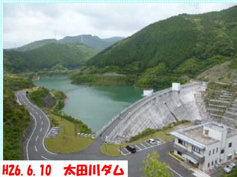
H26. 6. 10 木田川ダム