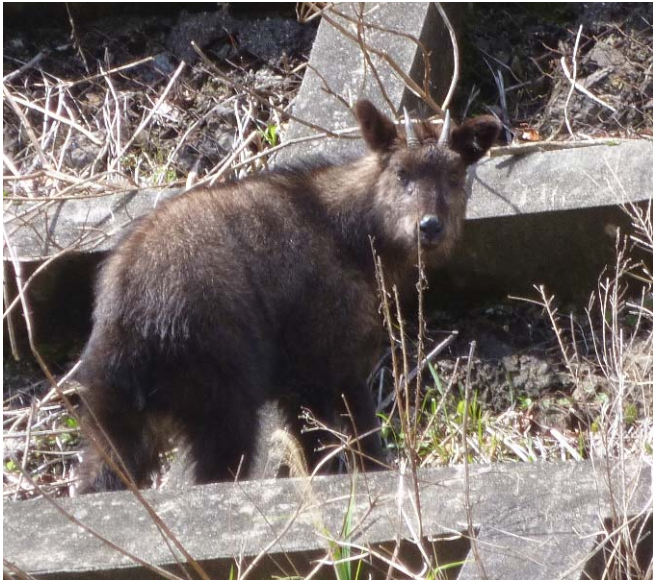
山の斜面から人間を観察しています。

ニホンカモシカ（天然記念物）や モリアオガエルなど、 ダム湖周辺ではめずらしい動物を見ることができます！ （運がよければ…。）