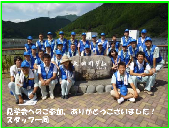
見学会へのご参加、ありがとうございました！ スタッフ一同