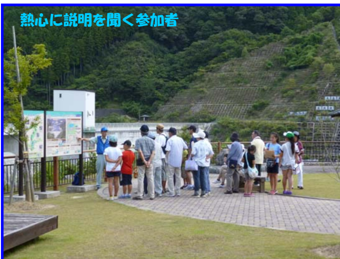
熱心に説明を聞く参加者

また最近、雨不足による渇水が続いていることから、太田川ダムが蓄えている水量について質問が寄せられるなど、ダムへの関心の高さがうかがえました。（※ダムの貯水率などは裏面に記載）