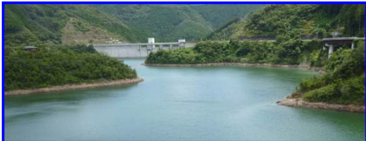
↑当日のかわせみ湖の状況 (常時満水位から約2m低下)

平成25年8月21日 9:00現在 ダム貯水位 H=268.55m ダム貯水率 86.6%