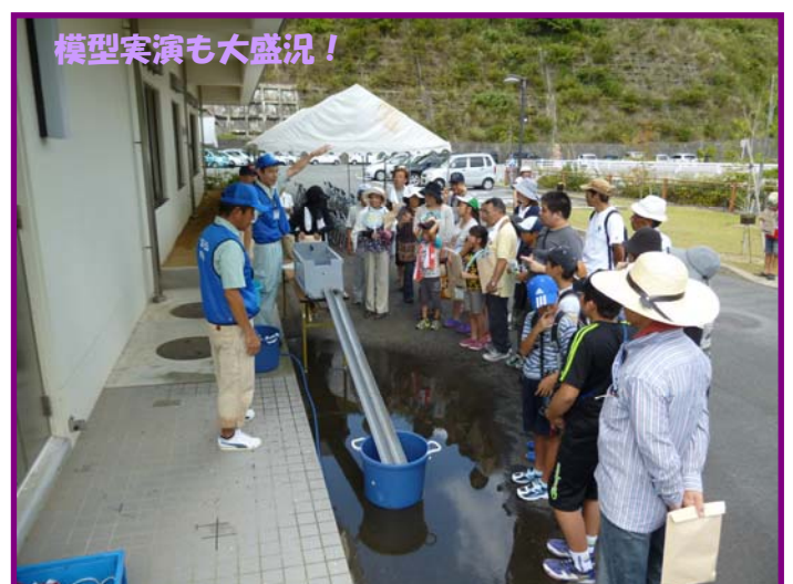
模型実演も大盛況！