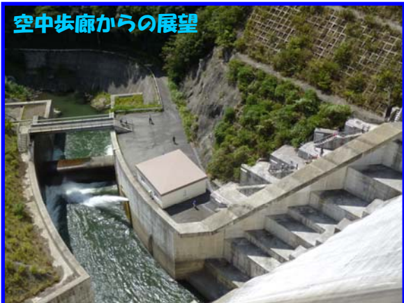
空中歩廊からの展望