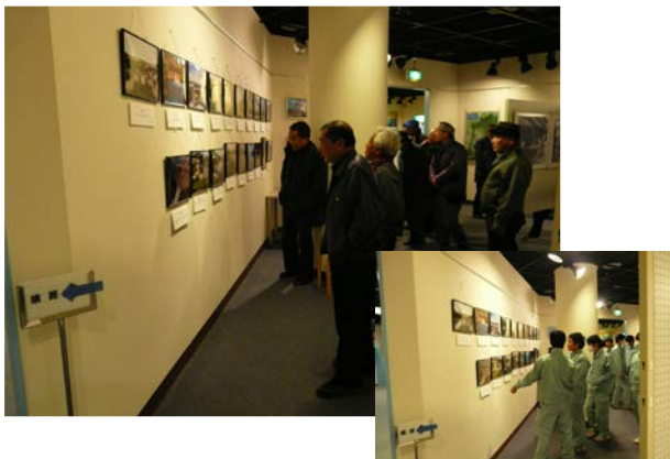
2012/9/11～9/30 水資源機構 矢木沢ダム(群馬県) 開催の様子