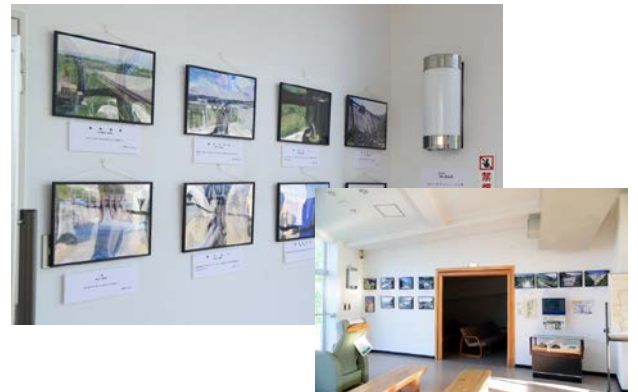
2013/2/2～2/17 水資源機構 長良川河口堰(三重県) 開催の様子