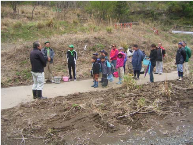
太田川漁協さんの説明を熱心に聞く子供たち

太田川漁協さんと地元森町のボーイスカウト約20名が、かわせみ湖上流端でヒメマスの放流を行いました。今回は伝倉沢で育てた2700匹を放流し、早ければ来年(H25)秋に成長したヒメマスが産卵のため育った伝倉沢へ戻ってきます。ヒメマスは産卵時期に腹から背中にかけて体が赤くなります。その赤くなった体を見せながら群れを成して戻ってくる姿『レッドライン』がかわせみ湖で見れると良いですね。