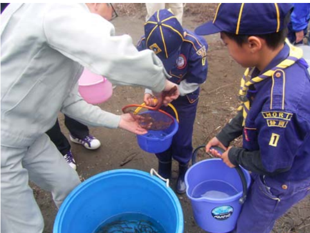
ヒメマスの稚魚を大事に受け取る