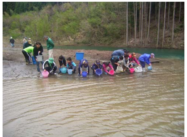
かわせみ湖へ放流。無事に帰ってきてね