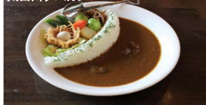
太田川ダムカレー