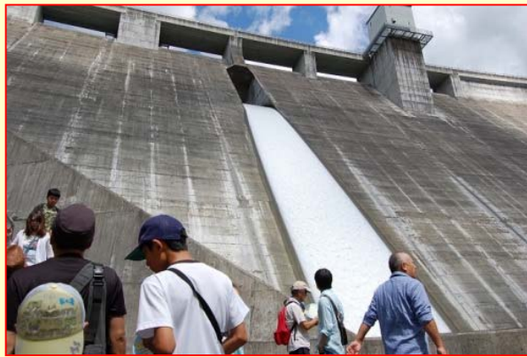
※ 写真のような放流は不定期で見ることができます。

太田川ダムでは、月1回（2,3月を除く）見学会を開催しています。普段は入れないダム内部に入り、下からダムを見上げてみませんか？実際にダムの管理をしている職員がわかりやすく説明いたします。