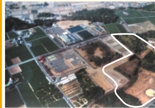
▲寺谷浄水場と新浄水場建設予定地（白線内）