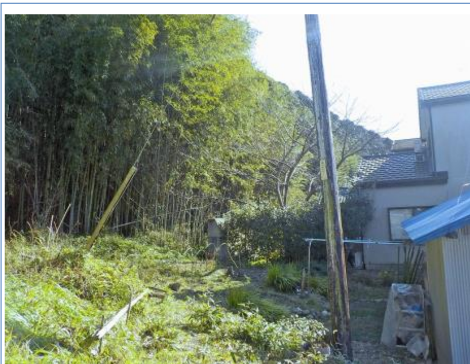
人家裏 着手前状況